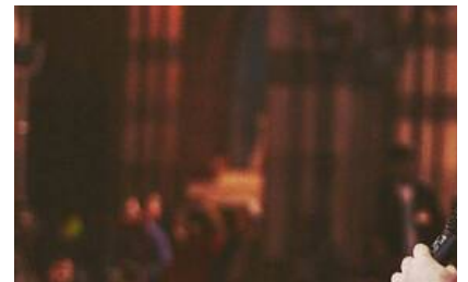
Una cierta Iglesia evanescente y la entraña del cristianismo