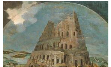
Inteligencia artificial y textos sagrados