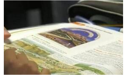
Cultura y religión