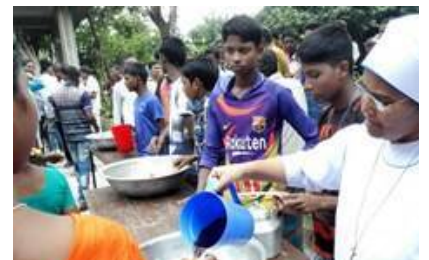
Cantalamesa: la compasión es clave de la misión de los apóstoles, la Iglesia existe para los demás