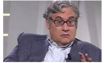
¿Una Iglesia bananera?