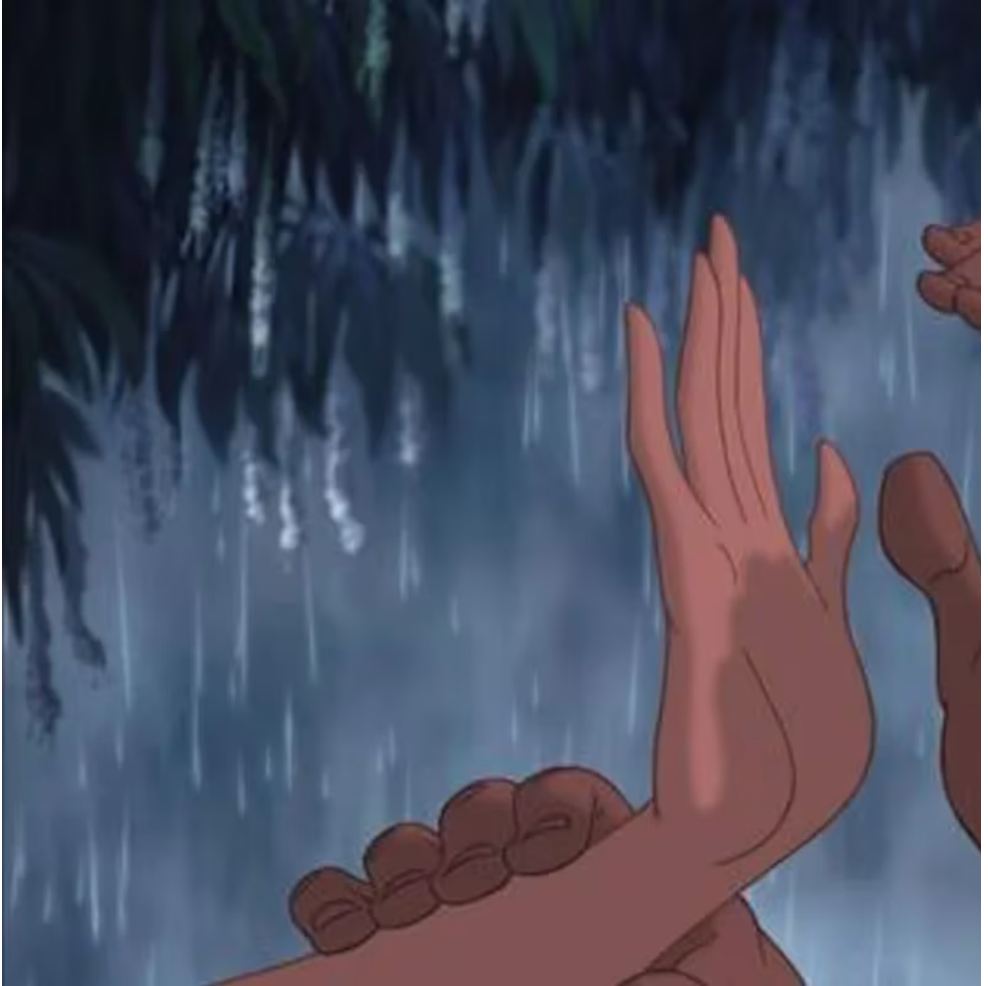
Manos de Jane y Tarzán en la película homónima de Disney

La película Tarzán , de Disney, nos muestra esta cuestión de un modo poético. Tarzán sabe que no es un gorila como sus padres o sus hermanos adoptivos porque sus manos son diferentes. Y reconoce a Jane como un ser de su especie cuando sus manos coinciden.